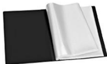
classeur chemises transp. non-amovibles