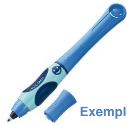
Exemple : stylo bille